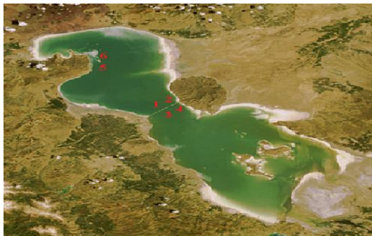
شکل ۱- عکس ماهواره‌ای و محل‌های نمونه‌برداری از

نمونه‌برداری از آب و نمک دریاچه ارومیه از شش ناحیه مختلف آن در بهار و تابستان سال ۱۳۹۲ انجام گرفت (شکل ۱). به دلیل بحران خشک‌سالی دریاچه ارومیه این کار تنها از دو طرف پل میان‌گذر دریاچه ارومیه و ناحیه شمال دریاچه ارومیه (ایستگاه باری) که پس‌روی آب دریاچه ارومیه کمتر هست امکان‌پذیر شد. شوری آب دریاچه در فصل بهار و تابستان ۱۳۹۲ در تمامی محل‌های نمونه‌برداری بیش از ۳۴۰ گرم در لیتر بود.